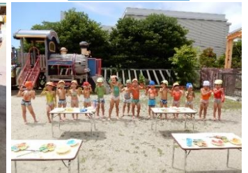
ポティペインティング