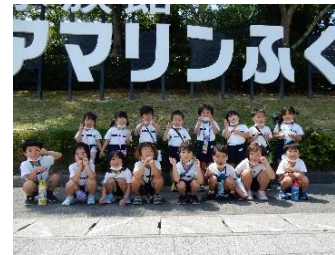
園外保育 アクアマリンふくしま