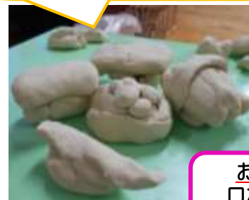
お寿司 & ロボット & ドーナツ☆