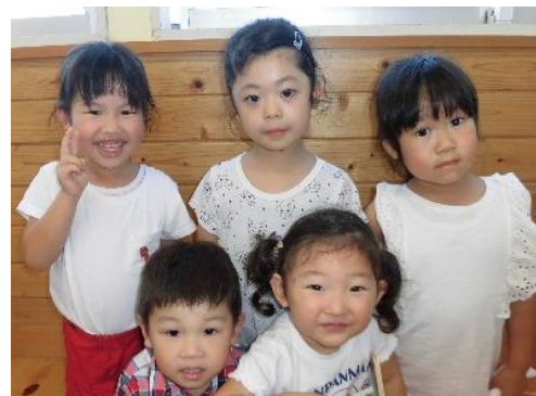
2・4・5歳児(左上より)