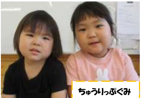
ちゅうりっぷぐみ