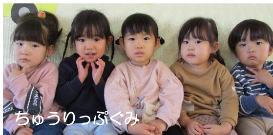
ちゅうりっぷぐみ

完璧な子育てはこの世にはありません。どうぞあなた流の子育てを自信を持って笑顔で楽しんでください。家族みんながしあわせに包まれるはずです。