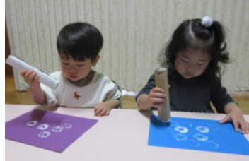
ペタペタスタンプ！！ 楽しいね♪