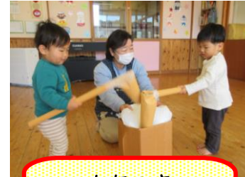
もちつき 楽しいね♪

もちつきに挑戦しました！！保育士がもちつきの歌を口ずさみながら見本を見せると、一緒に声をだして『ぺったんこ！』と真似をしていた子ども達。順番に名前を呼ばれるのをワクワクしながら待っていました。杵を持つとさっそく餅つき開始！！とても楽しそうにペタペタとついていました。